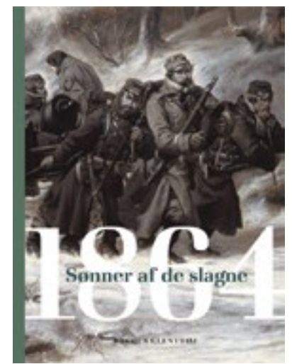
1864-Sønner af de Slagne (1864-Savaşta Yenilenlerin Çocukları (Tarih) Yazar Tarihçi Rasmus Glenthoj. Gads Forlag Yayınevi. 576 sayfa. 399,95 Kr.

ti. Çok ilginçtir ki, Almanya, 1. Dünya Savaşı'ndan sonra çizilen bu sınırla ilgili antlaşmayı halen imzalamamıştır. Danimarka tarihinin 1863 - 1864 dönemiyle ilgili olarak son yıllarda birkaç kitap yazıldı. Danimarka Radyosu'nun, bu çok önemli savaşı anlatan bir televizyon dizisinin çekimleri de şu günlerde tamamlanmak üzere. Şimdi en son olarak 18 Nisan 1864 Dybbøl muharebesinin 150. yılı dolayısıyla yeni bir tarih kitabı yayımlandı: 1864-Sønner af Slagne (1864-Savaşta Yenilerinin Çocukları). Tarihçi Rasmus Glenthoj'un yazdığı 567 sayfalık bu büyük yapıt 1864 yılının Danimarkalıların kimliğine ve tarihine vurmuş olduğu derin izler bırakan olaylar dizisini irdeliyor. Bundan önce bu konuda yazılmış olanlardan farklı olarak. Rasmus Glenthoj, bu dev yapıtıyla, aslında 1814'te Danimarka'nın Norveç'i de kaybetmesinden sonra başlayan 1864'ten sonra büyük hız kazanan yeni kimlik