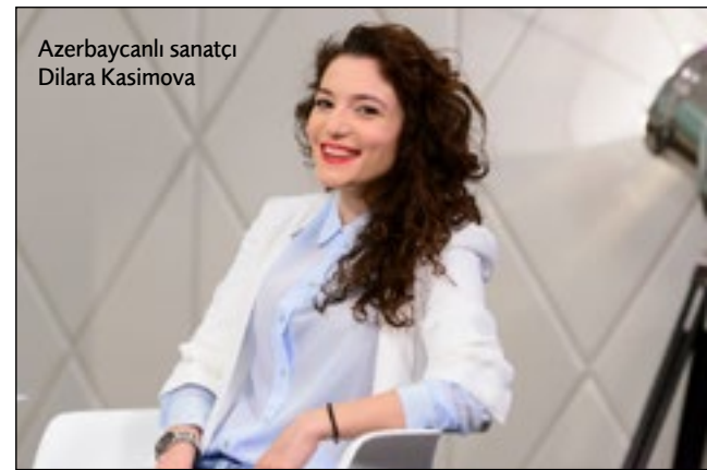
Azerbaycanlı sanatçı Dilara Kasimova