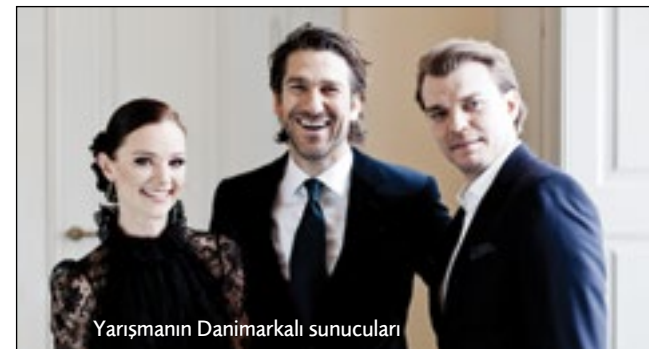
Yarışmanın Danimarkalı sunucuları

Topluma yeni söylemlerle giden bir politik kültürün ilkelerini Evet – Hayır yönetimiyle kaleme aldım. "Uçurtmanın rüzgarın gücüne karşı koyduğu için yükseldiğini farkına varan bilince" EVET, "Her akıntıya, her esintiye göre hareket edenlere değer vermeye" HAYIR denilmesi gerekir. - Başarıları alçak gönüllülükle görünür kilmaya, yaymaya EVET - Kendi kendini övmeye, böbürlenmeye HAYIR - Hızlı, sade iyileşme ile güç çoğaltmaya EVET - Belirsizliğe ve kötü kaliteye HAYIR - İlk önce kendi hatasını görüp, hatayı zamanında düzeltmeye EVET - Sadece başkalarının hatalarını konuşmaya HAYIR - İnsanların gerçek sorunlarına zamanında çözüm üretmeye EVET - Boş söylemler ve sahte problemler üzerinde laf salatası yapmaya HAYIR - Sevsek de sevmesek de her insana katlanmaya, sahip çıkmaya EVET - Bireysel çıkarların toplumsal çıkarların önüne geçmesine HAYIR - Düşündüren, geliştiren ve kucaklayıcı cevaplara EVET - İsmarlama boş cevaplara HAYIR