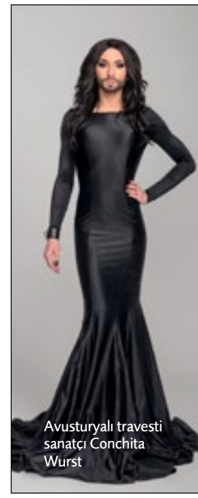
Avusturyalı travesti sanatçı Conchita Wurst